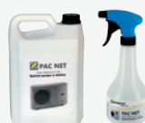
KIT PAC NET